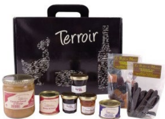
Paniers gourmands, épicerie fine, maroquinerie, bien-être...