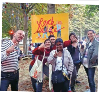
« Rock en Seine »