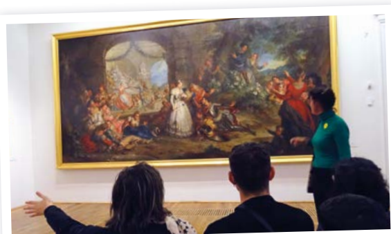
Visite du musée d'arts de Nantes