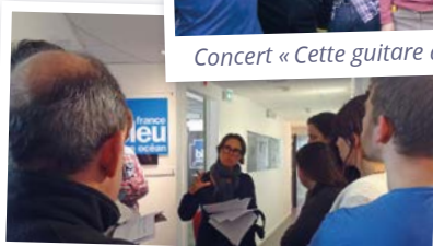
Visite des coulisses de radio France Bleu